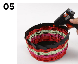
Vævningen afsuttets øverst på flettestativet, før tænderne slår et knæk. Brug en limpistol og luk med lim.