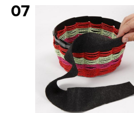
Filtstykket monteres på den dobbeltklæbende tape og bukkes ned over kanten - hele vejen rundt.