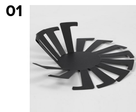
Tænderne på flettestativet løftes op fra bunden.

Kurven er flettet af kulørt paperyarn på et flettestativ. Kanten er afsluttet med filt, syet fast.