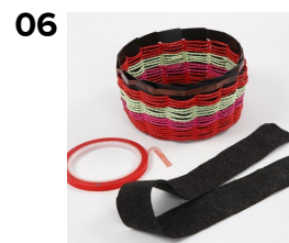
Dobbeltklæbende tape monteres på udvendig side af kurvens kant - hele vejen rundt. I en bredde på 4,5 cm klippet et stykke filt i samme længde som kurvens omkreds. OBS! Det store flettestativ har en dia. på 54 cm.