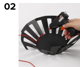
Brug en limpistol og fastgør papirgarnet på indvendig side, nederst ved en af tænderne.