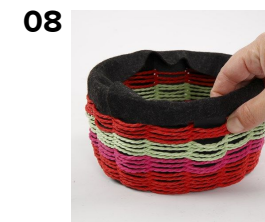
Under filtkanten presses vævningen lidt ned, så der kanten rundt bliver luft til at passere en nål, når filten fra næste trin syes fast.