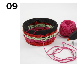
Klip et stykke papirgarn på 1 m, hvis' ende fastgøres med en klat lim på fletteskabelonen bag filten. Herefter syes filten fast, kanten rundt.