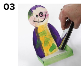
03 Den færdigudstansede figur samles med hæftetang og karse sås i den medfølgende plastbakke.