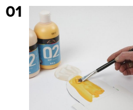
01 Figuren til karsebakken males med malingen A-Color mat

Den færdigudstansede karsebakkefigur er malet og stemplet med små gummistemples med A-color mat maling. Spirebakken samles med hæftetang og der såes karse i medfølgende bakke.