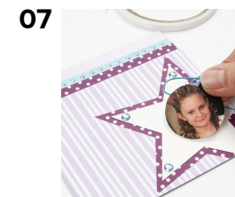
Foto printes, klippes til og fastgøres.

I det prikkede papir klippes/skæres en stjerne lidt større, end den store, færdiglavede stjerne.