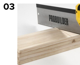
03 Blokken savs over lidt forskudt for midten. Heraf kan de to mindste huse laves.