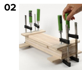
02 Under tørring holdes listerne fast med skruevinger.