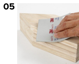
05 Kanterne slibes med en mellemgrov slibesvamp.