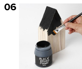
06 Taget males ed kulørt tavlelak eller hele huset males i sort tavlelak.