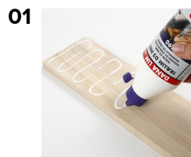
01 Fire lister limes sammen med trælim.