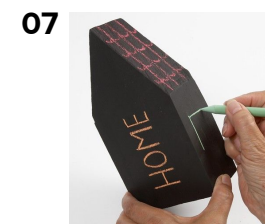
07 Tekst og vinduer tegnes med tavlekrid.