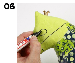
Ekstra detaljer optegnes med tusch.