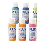
Plus Color hobbymaling, colorful, 60 ml/1 pk. 39695