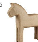
Hest, H: 24,5 cm, 1stk. 510710