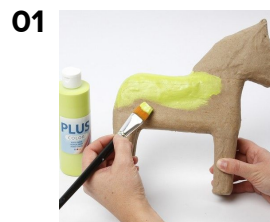
Papemnet males med Plus Color Hobbymaling.

Papemne, malet med Plus Color Hobbymaling og decouperet med decoupagepapir, påsat med VTR klæber. Herefter dekoreret yderligere med små emner i træ og mosgummi.