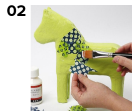
Decoupagepapir rives i små stykker og limes på papemnet med VTR klæber eller decoupagelak.