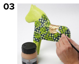
En sadel males på med Art Metal, Guld.