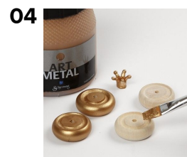
Hjul og krone males.