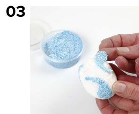
03 Dernæst laves et ønsket mønster i én eller flere af farverne. Det pæneste resultat opnåes, hvis man lader den hvide Foam Clay tørre helt, før der lægges et mønster.