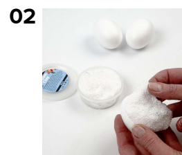
02 Ægget beklædes med Foam Clay.