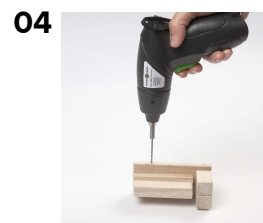
04 Huller til hjul forbores.