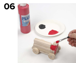
06 Bilen males med Plus Color hobbymaling fortyndet med lidt vand.