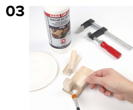
03 Delene limes sammen med trælim.