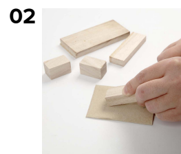
02 Træstykkernes ender pudses på et stykke sandpapir.