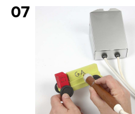
07 Tegninger og tekst brændes med elbrænder.