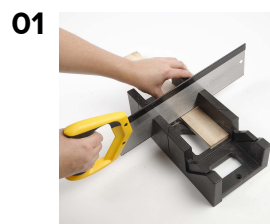
01 Trælister saves ud i små stykker.

Trælister og stave er savet, slebet med sandpapir og limet sammen. Hjul, master m.m. er tilføjet, og der er malet med Plus Color dækkende og fortyndet. Streger er tusch eller lavet med elbrænder.