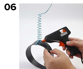
06 Tråden limes fast med limpistol.