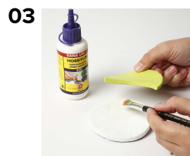
03 Figurene limes sammen med hobbylim. (Limpistol kan evt. bruges til øjenvipper.)