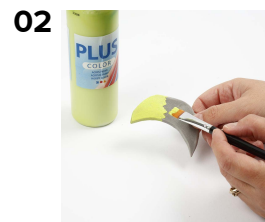
02 Figurene males med Plus Color hobbymaling.