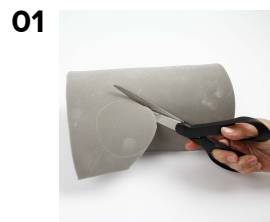
01 Figurer klippes ud i liggeunderlag.

Den flotte hårpynt er lavet af liggeunderlag, som er klippet ud i figurer, malet med Plus Color hobbymaling og monteret på hårbøjler.