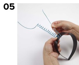
05 Den ene ende vikles rundt om hårbøjlen.