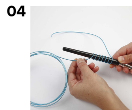
04 Der laves en spiral af bonzaitråd omkring en pind eller en anden rund genstand.