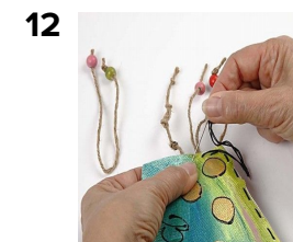
12 Syes sammen i bunden sammen med snorene med perler.