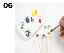
06 Træperler males i matchende farver.