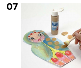
07 Guldbomber laves med en skumpensel og Plus Color guld.