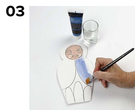
03 Der males med fortyndet Pigment maling. Hudfarven fås ved at blande brunt med hvidt.