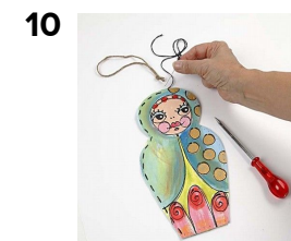
10 Delene syes sammen med en dobbelt bomuldstråd. Hullerne prikkes evt. med en syl. Husk at sy ophængstråden med. Dukkes skal ikke syes sammen fornedet endnu.