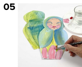
05 Primær rød og hvid giver pink og rosa. Husk at male en figur til bagsiden.