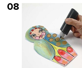
08 Sort Pigment maling hældes i en påfyldningsflaske, og alle konturer tegnes op. En tekst skrives på bagsiden.