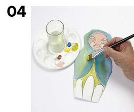
04 Lidt blå i gult giver en flot limefarve.