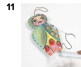
11 Dukken fyldes let med pudefyld.