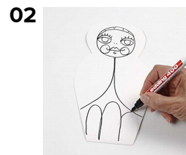
02 Stregene markeres med en tuschpen.