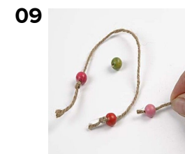
09 Perlerne sættes på snor.