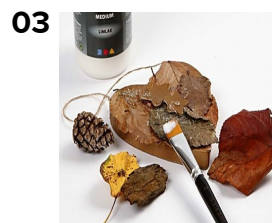
Lim naturmaterialer på hjertet med rigelig A-color medium limlak. Dyp også penslen i Art Metal guld og drys glimmerdrys på til sidst.