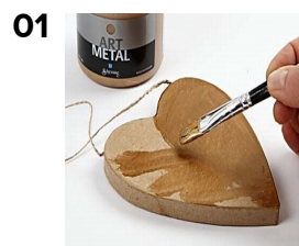
Mål paphjertet med Art Metal guld.

Paphjerter er penslet med A-color limlak og lidt Art metal guldmaling. Blade, kogler, træmosaik m.m. er lagt ovenpå med limen og glimmerdrys er tilføjet til sidst.