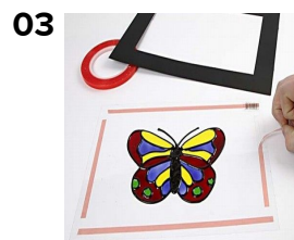
Klæb ramme på med Powertape.