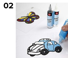
Fyld ud med Window Color vinduesmaling. ( Tørretid cirka 24 timer )