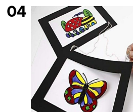
Lav ophæng, her gjort med krokodillenaeb og smykkekedede.