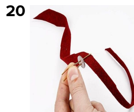
Tag en af strimlerne og træk den gennem en "nitte" som vist.