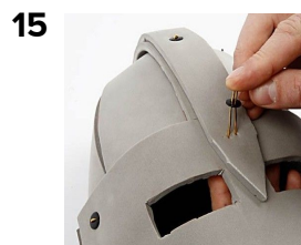
Monter "nitterne" på hjelmen ved at presse dem gennem skummet.