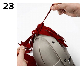
Bind nu de resterende filtbånd fast med det monterede bånd.