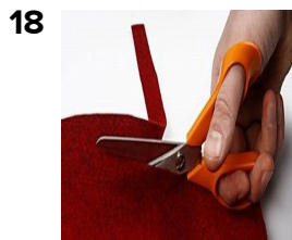
Klip en 6-10 strimler (cirka: 1x50 cm) i filt til hjelm prydelse. □