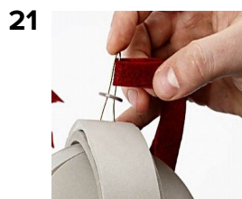
Monter den så på toppen af hjelmen.