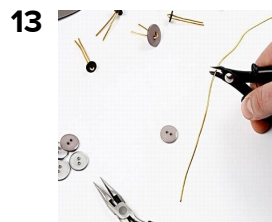
Lav "nitter" af knapper og Bonzaitråd som vist.