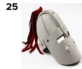
Den færdige Hjelm.