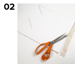
02 Klip 4 stykker filt hvor mønstret ligger i samme retning. Brug 2 forskellige mønstre, til posens sider.