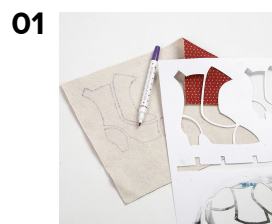
01 Tegn skabelonen på et stykke filt.

Søde poser syet efter mønster i Vivi Gade filt. Pyntet med bånd.