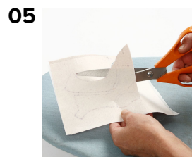
05 Klip støvlen ud.