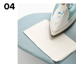
04 Stryg vliesofixen på.