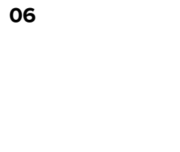
06 Fjern papiret fra vliesofixen.