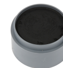
Grimas Ansigtsmaling, sort, 15ml 77020