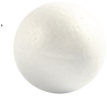
Kugle, diam. 5 cm, hvid, styropor, 5stk. 543040